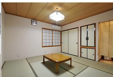
101 / ゲストルーム